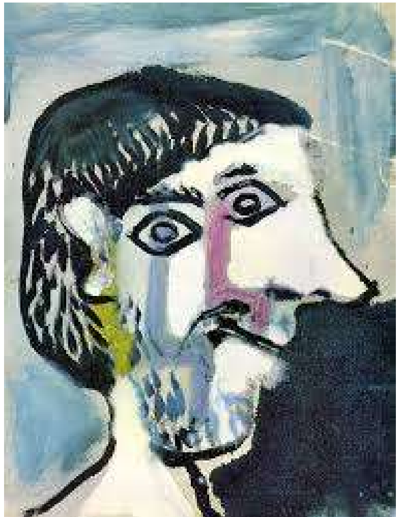
Pablo Picasso 1881-1973 Tête d'homme 1964