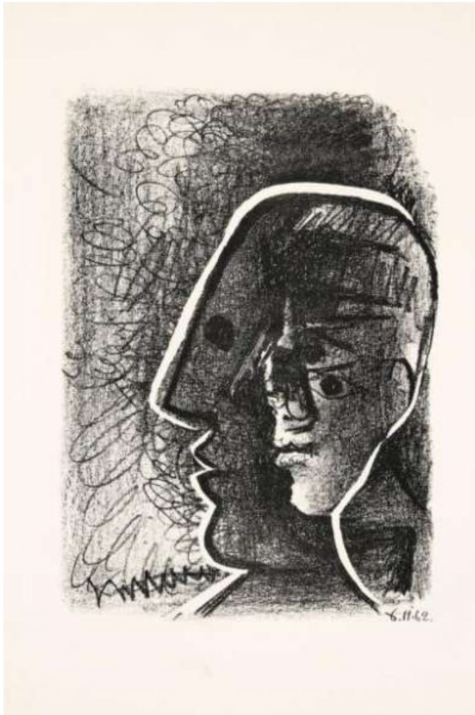
Pablo Picasso 1881-1973 Profil de Jean Cocteau 1962 Lithographie