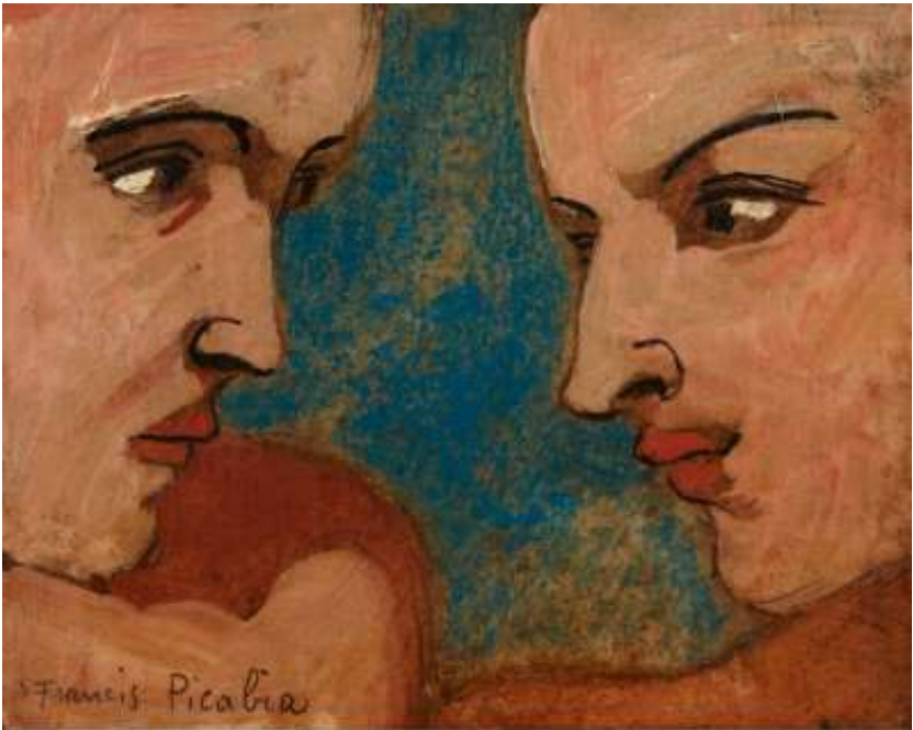
Francis Picabia 1879-1953 Deux têtes