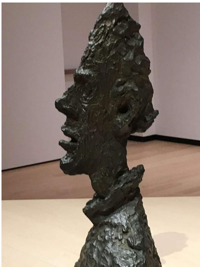
Alberto Giacometti 1901-1966 Buste de Diego 1955