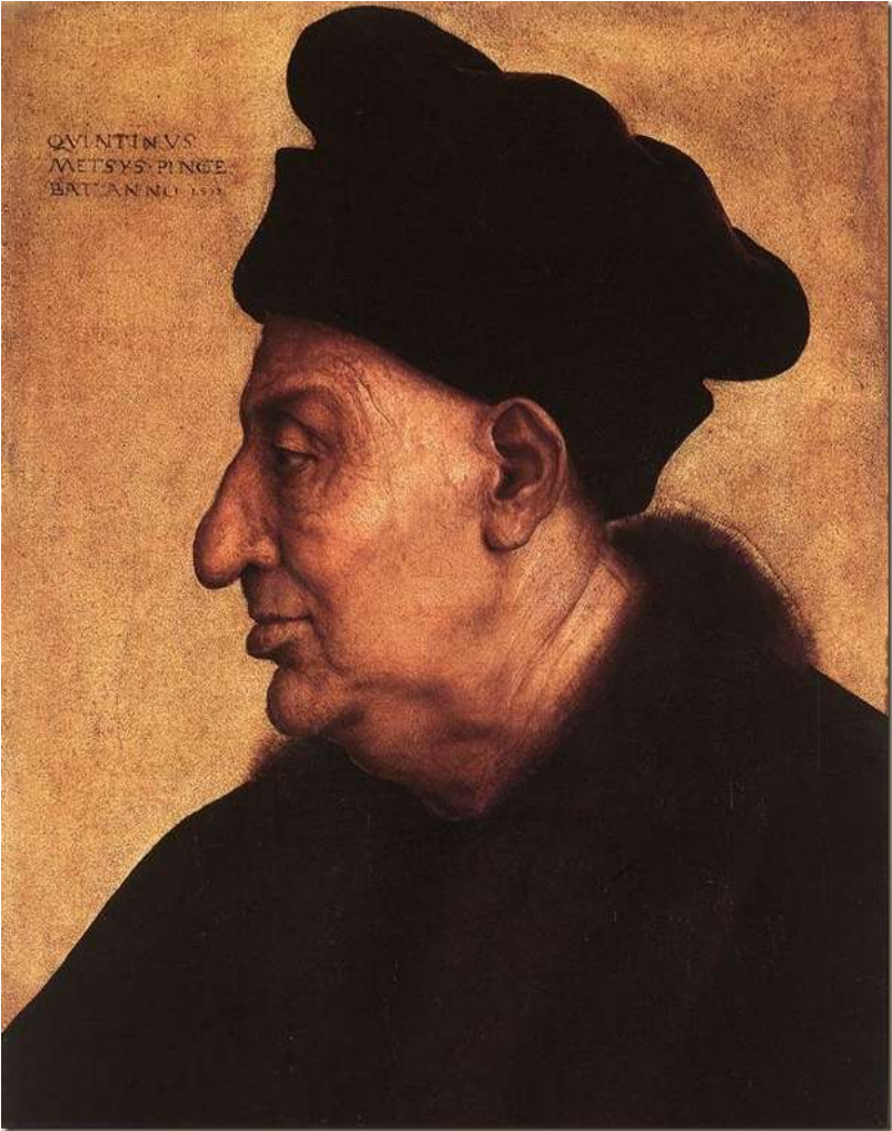
Quentin Metsys 1466-1530 Le vieil Homme 1513