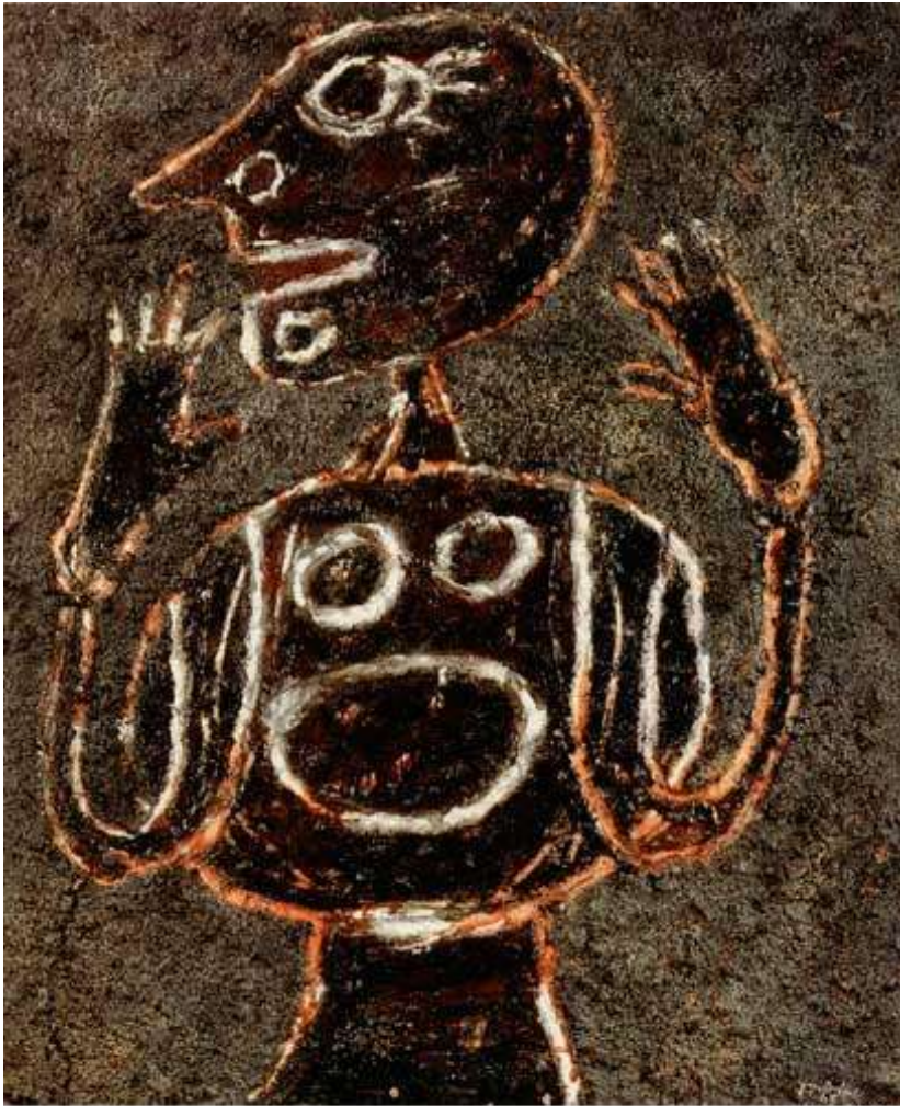
Jean Dubuffet 1901-1985 Madame Mouche 1945