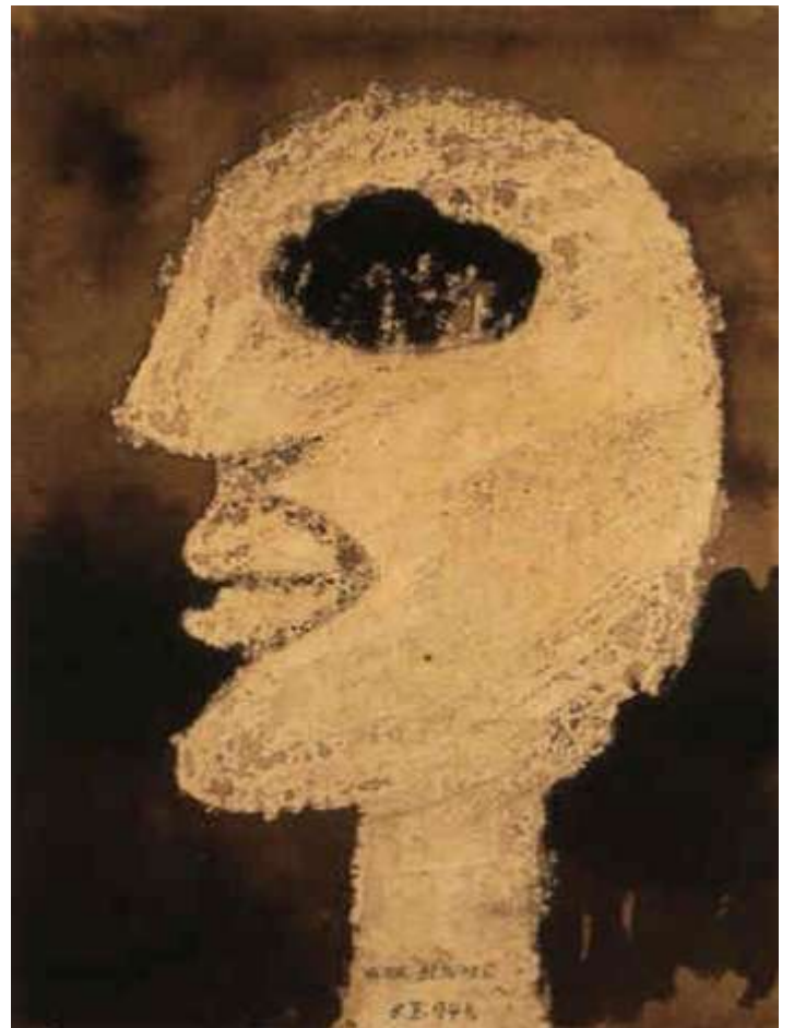
Victor Brauner 1903-1966 Tête en Profil 1944