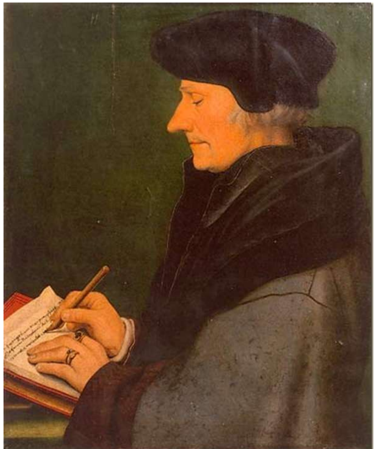
Hans Holbein 1497-1543 Erasmus 1523