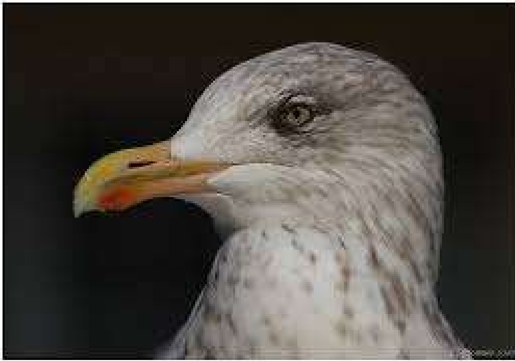
Tête de Goéland