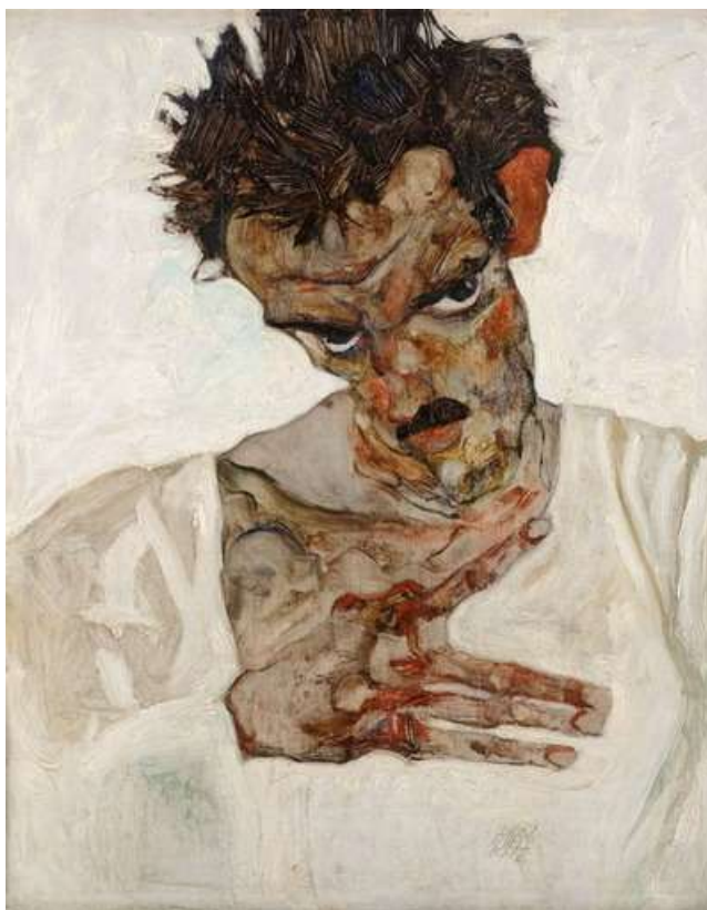
Francis Bacon 1909-1992 Etude pour Autoportrait 1980