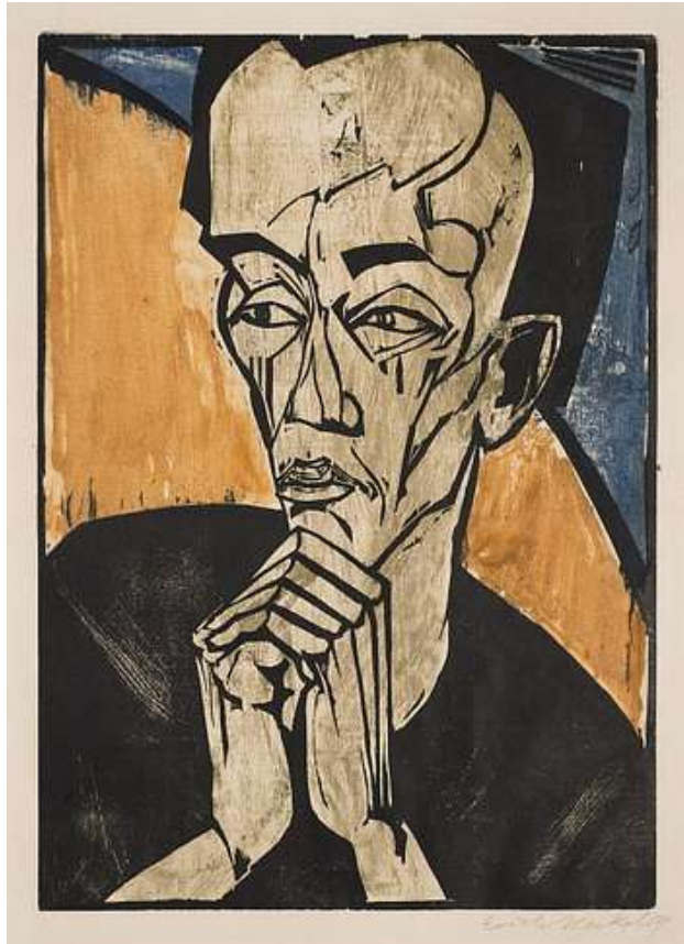
Oskar Kokoschka 1886-1980 Portrait de Karl Kraus 1910