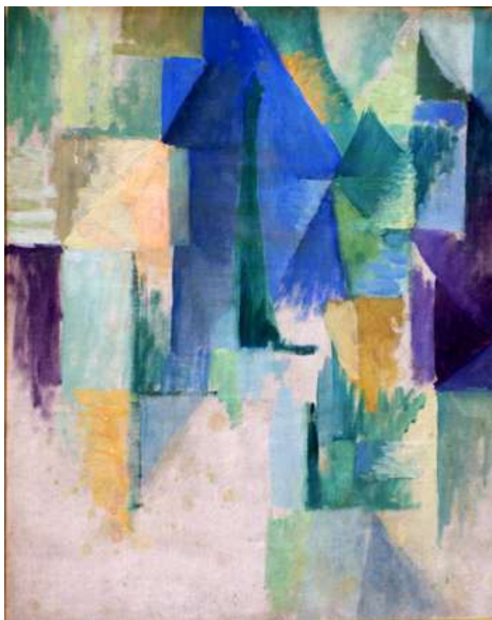
Balthus 1908-2001 La Fenêtre Cour de Rohan 1951