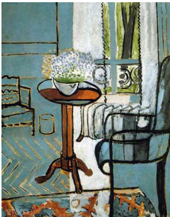
Georges Braque 1882-1963 Le Salon 1944