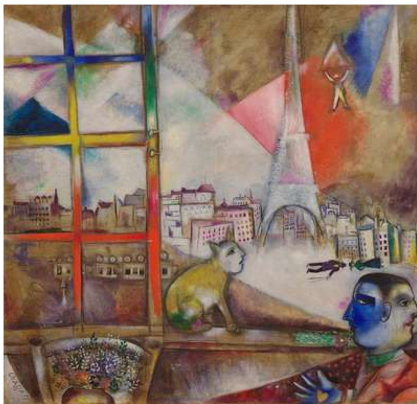
Paul Klee 1897- 1940 Vue de fenêtre, île de nord 1923