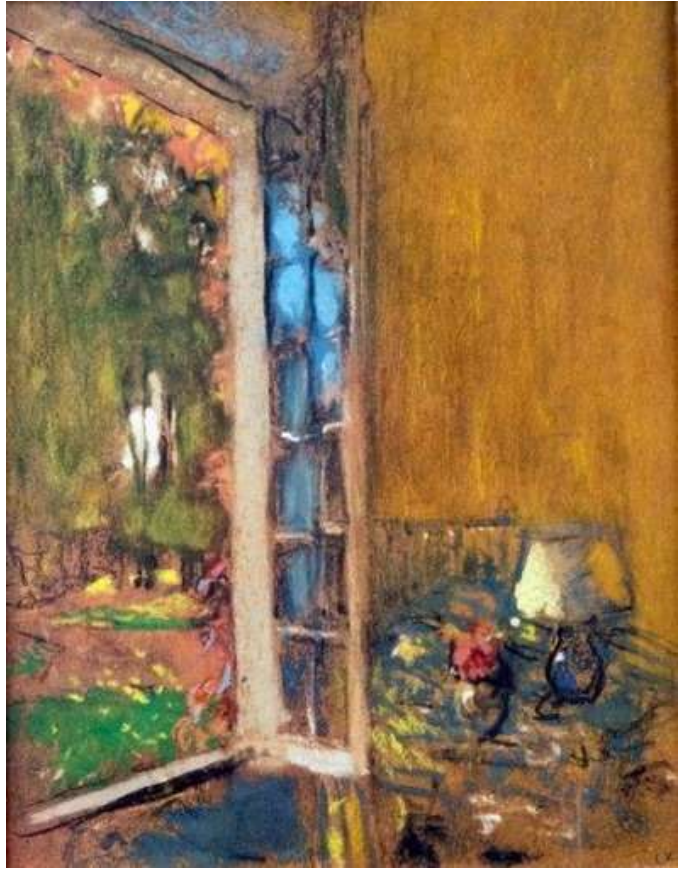
Edouard Vuillard 1868-1940 Fenêtre sur jardin