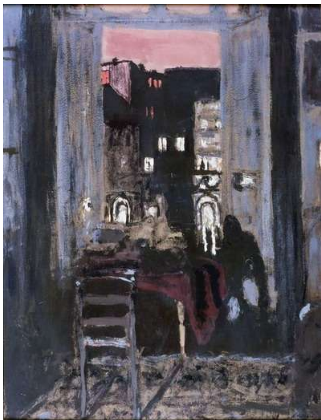
Albert Marquet 1875-1947 Chat blanc dans l'atelier 1935