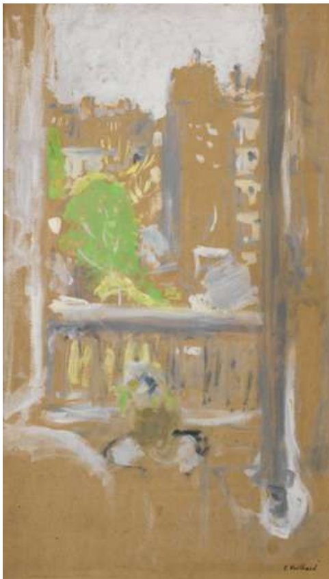
Edouard Vuillard 1868-1940 Vuillard, fenêtre sur jardinet-gouache