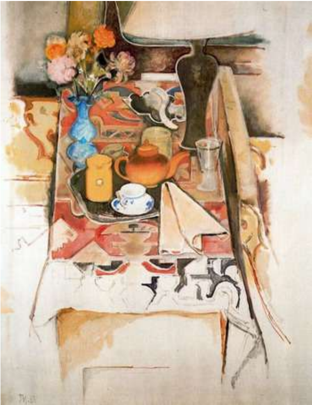
Bernard Buffet 1928 – 1999 NM à la Lampe et aux Cartes 1963