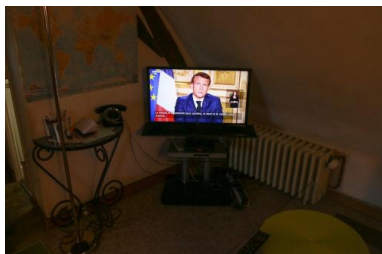
Le président Emmanuel Macron lors de son allocution le 13 avril 2020.

PAR EDWY PLENEL ARTICLE PUBLIÉ LE LUNDI 4 MAI 2020