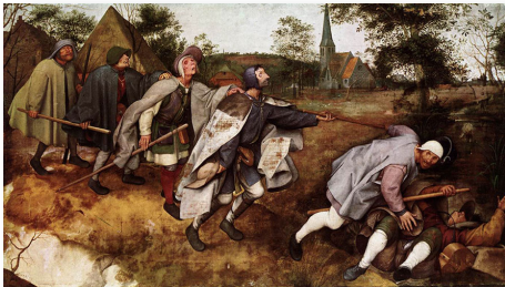
Pieter Brueghel l'Ancien. — "La Parole des aveugles", 1568. - Musée Capodimonte de Naples.

Quand un problème est trop embarrassant, il y a toujours la possibilité de regarder ailleurs. Avec une parfaite constance dans l'évitement, un sens du slogan qui fait penser à une publicité de la SNCF des années 80 (" Changer l'Europe, c'est possible ! "), et une conception de la politique essentiellement empruntée au mouvement scout (" À condition toutefois que l'on s'y mette tous "), le groupe