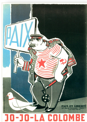
Affiche de l'association anticommuniste Paix et liberté, 1952.

On peut tenir pour l'un des symptômes les plus caractéristiques des crises organiques l'emballement des événements, et la survenue à haute fréquence de faits ou de déclarations parfaitement renversants. En moins de vingt-quatre heures, nous aurons eu les enregistrements Benalla, aussitôt enchaînés avec une rafale de propos à demi-"off" signés Macron, et la mesure du dérèglement général est donnée à ceci que, dans la compétition des deux, c'est Benalla qui fait figure de gnome. En fait, on n'arrive plus à suivre.