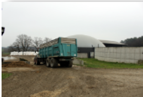
Pour nourrir son méthaniseur, Stéphane Bodiguel achète l'extérieur la majeure partie de son substrat.

Ses dépenses pour acheter des déchets explosent, mais sa production de méthane lui permet de rester bénéficiaire.