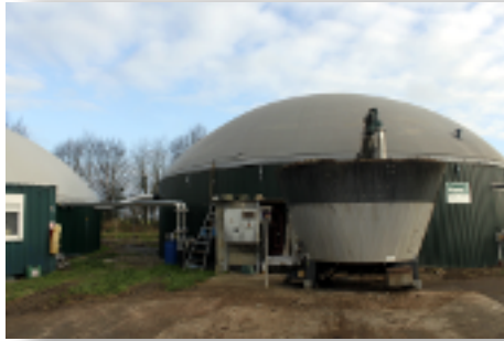
La cuve déverse chaque jour 16 tonnes de substrat à l'intérieur du dôme.

Le méthaniseur, aussi appelé digesteur, se nourrit de plusieurs tonnes de substrat par jour. Le substrat se compose généralement d'une bonne part de déjections animales, suivies de cultures intermédiaires (avoine, orge, etc.), de déchets de l'agroalimentaire, de déchets verts (coupes de pelouse, de bords de route) et, parfois, de boues de station d'épuration. C'est le savant mélange de ces ingrédients qui permet de produire un maximum de méthane à réinjecter dans le réseau, mais aussi un digestat qui servira d'engrais.