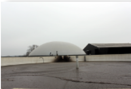
Le méthaniseur, reconnaissable à son dôme, rejette dans cette cuve le digestat, qui sera ensuite épandu dans les champs comme engrais.

Le compostage est beaucoup plus efficace, tout comme la méthanisation dépassant les 50 °C. Une phase d'"hygiénisation" — une période d'une heure de chauffe à plus de 70 °C — permettrait un meilleur "nettoyage" du digestat, mais elle n'est pas obligatoire pour toutes les exploitations. Et les systèmes les plus utilisés s'arrêtent aux 40 °C.