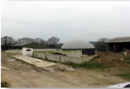
Un méthaniseur d'une puissance de 610 kW.

"Consummé par le sol, le digestat s'infiltré vers les cours d'eau et les nappes phréatiques"