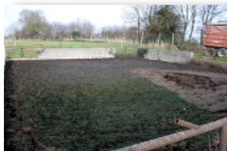
Le digestat obtenu est stocké dans cette cuve avant épandage.

La résistance accrue des bactéries est liée à de nombreux facteurs, comme la surconsommation médicamenteuse, dont celles des antibiotiques. Les scientifiques du CSNM craignent que la méthanisation, indirectement, participe à ce phénomène.