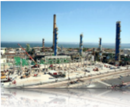
La raffinerie de Total de La Mède, à Châteauneuf-les-Martigues.

"un dialogue positif avec le ministère de la Transition écologique et solidaire", Total a annoncé ce 16 mai, par voie de communiqué, limiter l'approvisionnement "en huile de palme brute à un volume inférieur à 50 % des volumes de matières premières qui seront traitées sur le site, soit, au plus, 300.000 tonnes par an".