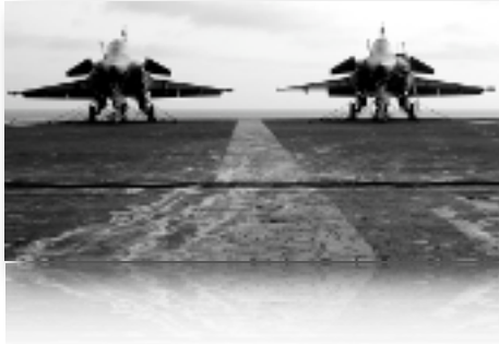
Deux avions de chasse Rafale sur le pont du "Charles-de-Gaulle".

Si les importations venaient à se tarir, la Malaisie menace de ne pas acheter 18 avions Rafale, comme l'indiquait L'Usine nouvelle en mars 13 au profit d'un concurrent britannique. De fait, il y avait divergence entre Nicolas Hulot et Florence Parly, la ministre de la Défense. Les considérations commerciales semblent l'avoir emporté sur les considérations écologiques.