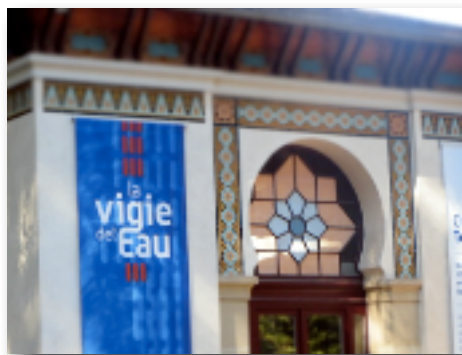
Musée de la Vigie de l'eau, à Vittel.

"Elle fait partie des nombreuses associations que nous soutenons sur le territoire", explique le porte-parole de l'entreprise.