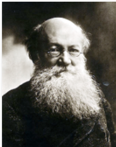
Pierre Kropotkine (1842-1921).

Partant du constat (erroné) que la compétition est dominante dans le règne animal, la plupart des intellectuels de cette époque ont décidé d'en faire une loi naturelle chez les humains, justifiant ainsi les inégalités et la pauvreté. Refusant cette fable, qu'on appelle "darwinisme social", Kropotkine nous livre une contre-histoire de l'humanité. Pas celle des grands hommes et de leurs luttes pour le pouvoir et le prestige, mais celle des masses de paysans, de nomades et de prolétaires qui luttent ensemble pour faire face aux différents défis posés par l'existence. Dans ce livre, il nous raconte l'histoire de ceux dont se fiche l'Histoire. Et ça fait un bien fou.