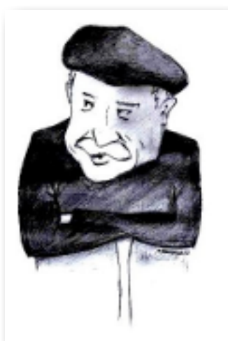
- Murray Bookchin -

Il est donc nécessaire d'imaginer des alternatives écologiques et simultanément de réinvestir le champ politique. Tel est le souhait de Murray Bookchin qui, au travers du municipalisme libertaire dessine le projet politique d'une démocratie du "face to face", une démocratie directe à laquelle tous les acteurs sont appelés, grâce en particulier aux assemblées populaires, à apporter leurs contributions.