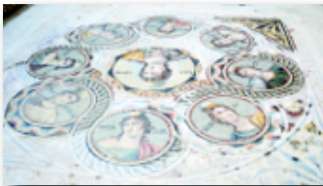
The nine Muses, the goddesses of the inspiration of literature, science and the arts.

"They were a product of the patron's imagination. It wasn't like simply choosing from a catalog," Grkay tells Archaeology.org . "They thought of specific scenes in order to make a specific impression."