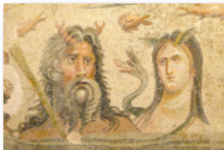
Oceanus, the divine personification of the sea, and his sister/consort Tethys, the embodiment of the waters of the world

former cultural crossroads was forgotten, until new life began to be breathed into the city thanks to attention from the ongoing excavations.