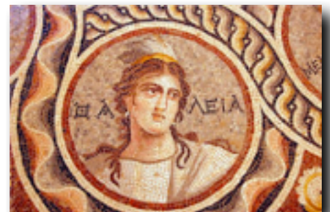
Thalia, the Muse of comedy and idyllic poetry

For several centuries, Zeugma served as one of the most important centers of the Eastern Roman Empire thanks to its geographic location on the border between the Greco-Roman world and the Persian Empire. As the Roman Empire declined, so did Zeugma , until it finally fell in AD 253 when Sassanids from Persia attacked the city. For over a thousand years, the importance and grandeur of the