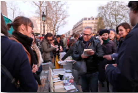
La bibliothèque debout, fin avril.

Des hommes ? La population sur la place est bien aux deux tiers masculine. Cela peut s'expliquer en partie par le lieu – un espace public urbain – et les horaires tardifs, qui ne favorisent pas la présence des femmes, du fait de possibles engagements familiaux et de l'exposition au harcèlement de rue. Cette distribution inégale est l'objet de réflexions et d'actions au sein du mouvement, en commissions féministes comme en Assemblée générale.