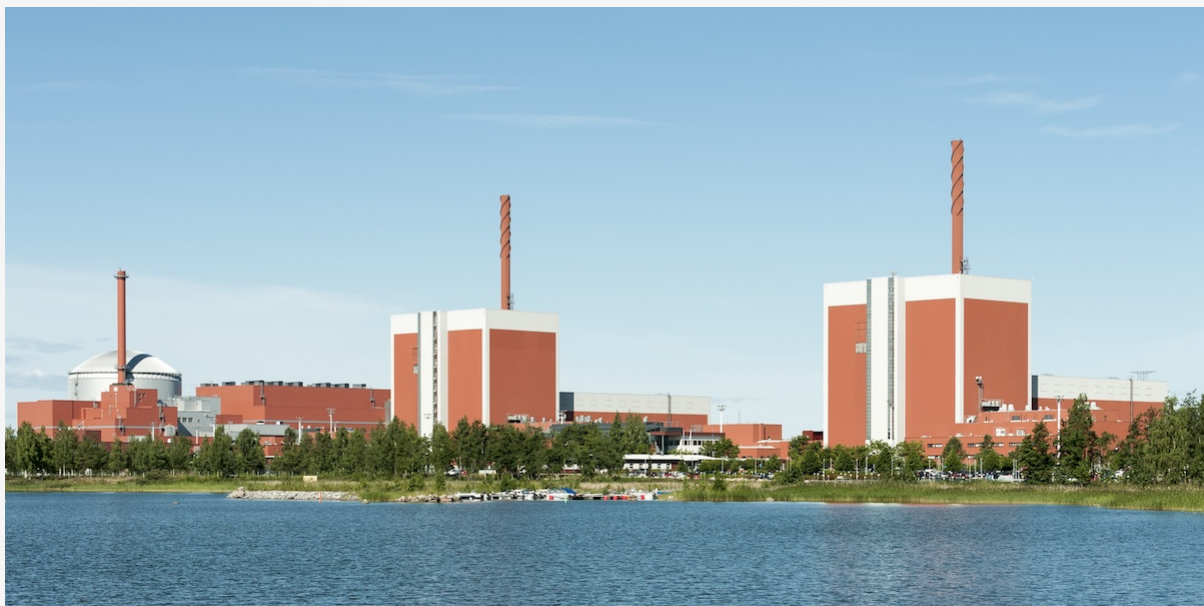
Les deux réacteurs en activité de la centrale finlandaise d'Olkiluoto, en 2015. Le troisième réacteur devrait être un EPR, mais sa construction accumule douze ans de retard et sa facture a triplé.