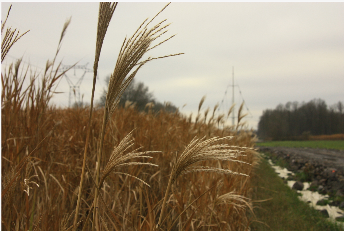
L'herbe à éléphant, appelée miscanthus, est majoritairement utilisée comme combustible pour le chauffage.