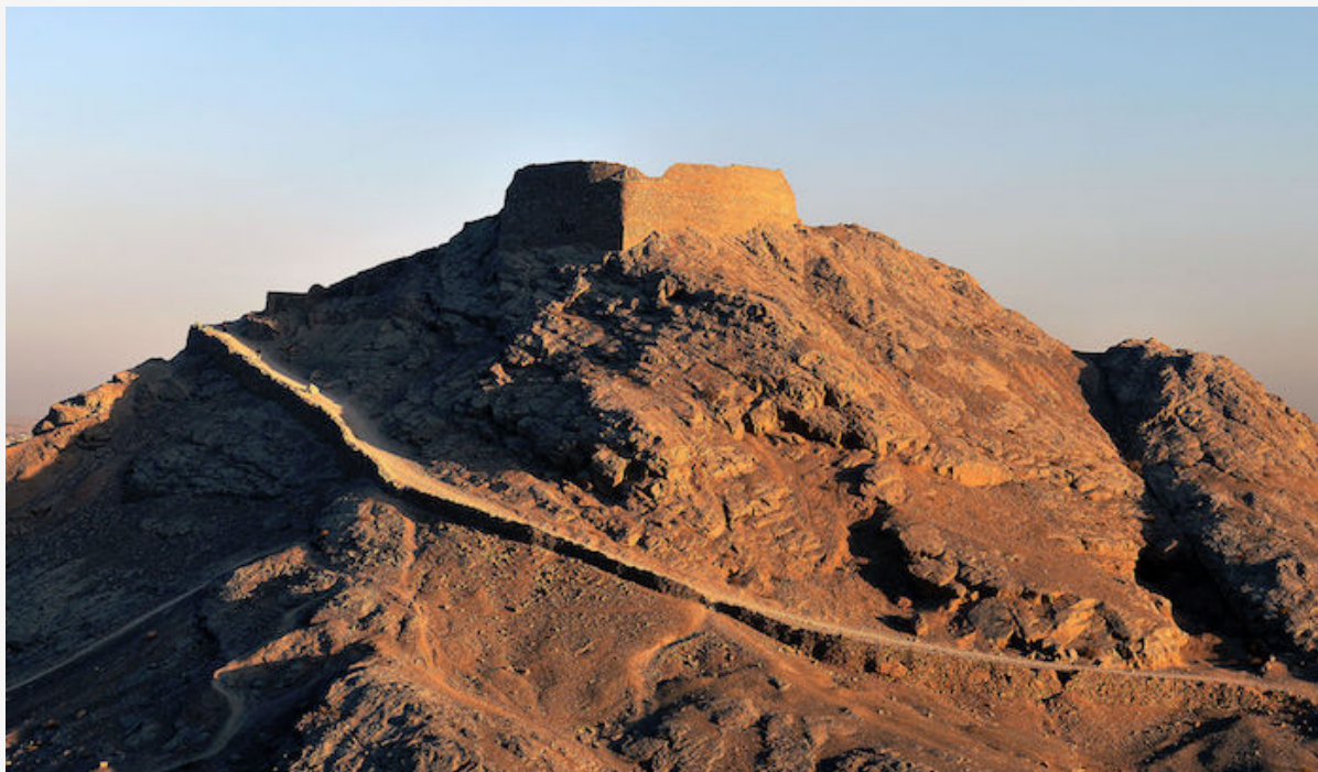
Une « tour du silence » zoroastrienne, en Iran.