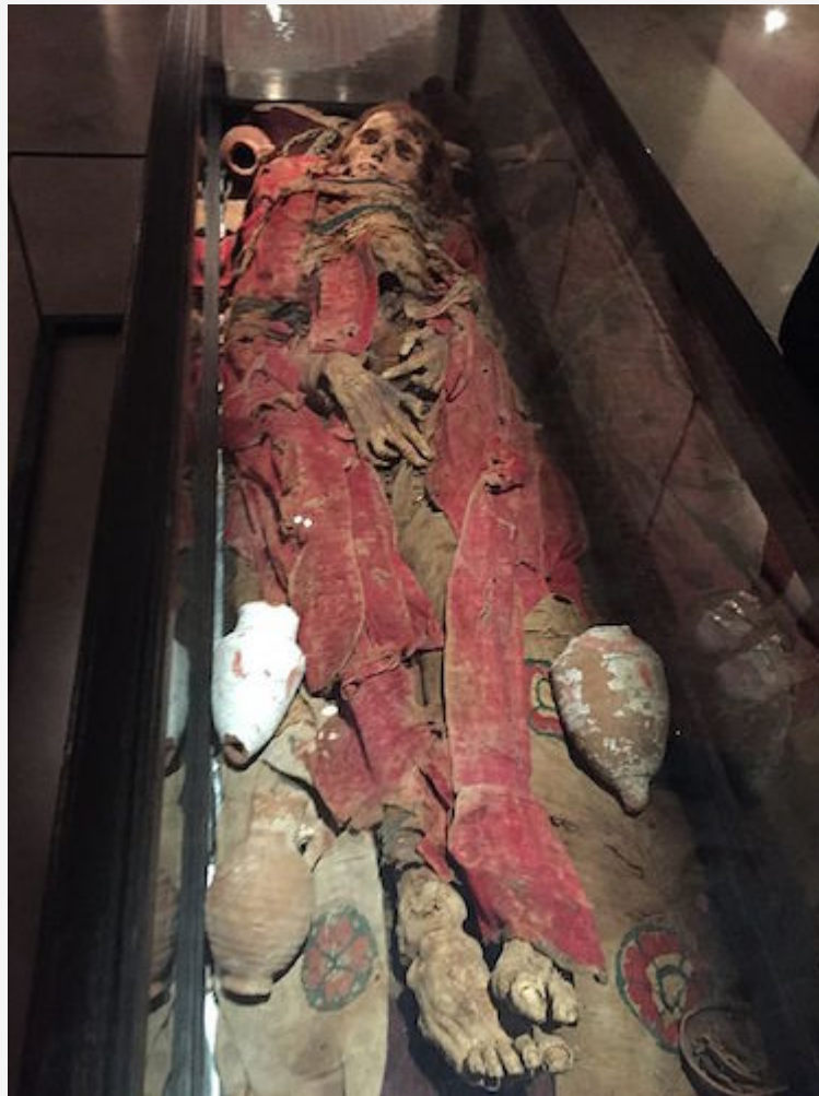
Une momie égyptienne.

Oui. À partir des années 1970-1980 est apparu, notamment aux États-Unis, le désir « d'esthétiser » la mort, comme pour la rendre plus supportable. La thanatopraxie n'est donc pas simplement un soin de conservation, mais une mise en scène. Il y a une réelle volonté de gommer la mort, avec une certaine idée d'immortalité. Il faut avoir l'impression que le défunt « dort ». Ce qui peut considérablement compliquer le travail de deuil.