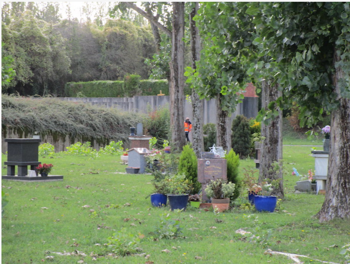
Le cimetière de Joncherolles.