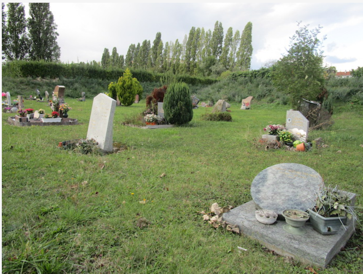
Les tombes paysagères du cimetière de Joncherolles.

« Il y a une demande de gestion plus écologique des cimetières. Mais en même temps, on injecte des litres de formol dans les corps. C'est incohérent », observe Valérie Bailly, membre du Syndicat intercommunal funéraire de la région parisienne (Sifurep), chargée de la visite. Elle explique que des tests ont été réalisés pour vérifier que les sols du site n'étaient pas pollués. Le cimetière des Joncherolles réfléchit actuellement à la mise en place une politique se rapprochant de celle du cimetière naturel de Souché (Deux-Sèvres), près de Niort, qui n'accepte plus les corps ayant été traités au formol.