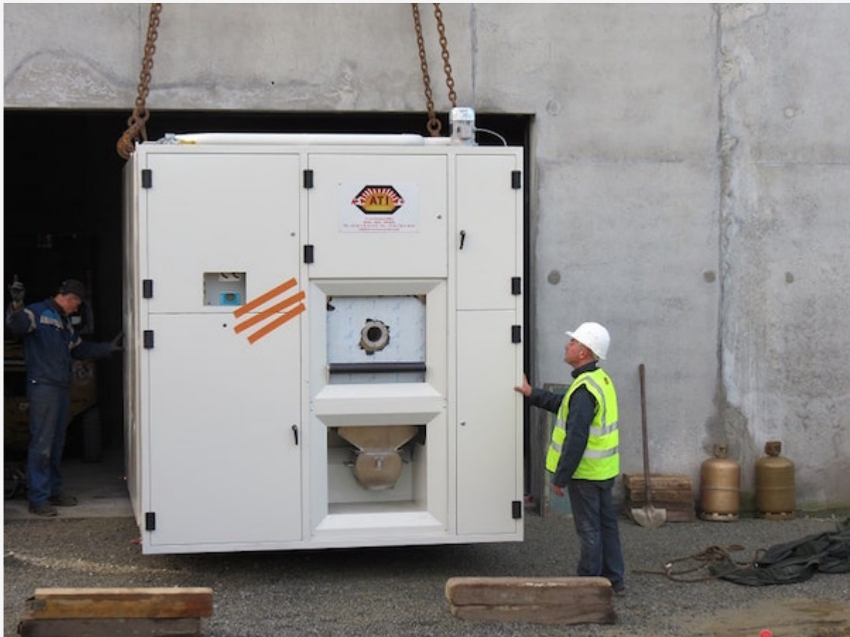
Installation d'un four, avec filtre, pour crématorium à Noyal-Pontivy, en Bretagne, en 2016.

Face à cette situation, la législation s'est renforcée peu à peu, faisant reculer les émissions globales de mercure. En effet, le rapport Secten, datant d'avril 2013 et rédigé par le Centre interprofessionnel technique d'études de la pollution atmosphérique (Citepa), estime que 4,7 tonnes de mercure ont été rejetées dans l'atmosphère en France en 2011 — contre 24,7 tonnes en 1990. Toutefois, le nombre de crémations n'a jamais été aussi important : autorisée depuis 1889, la crémation représentait 1 % des obsèques en 1979, 32 % en 2012, et près de 40 % actuellement. La question des amalgames dentaires (même s'ils sont de moins en moins utilisés), et des rejets de mercure reste donc brûlante.