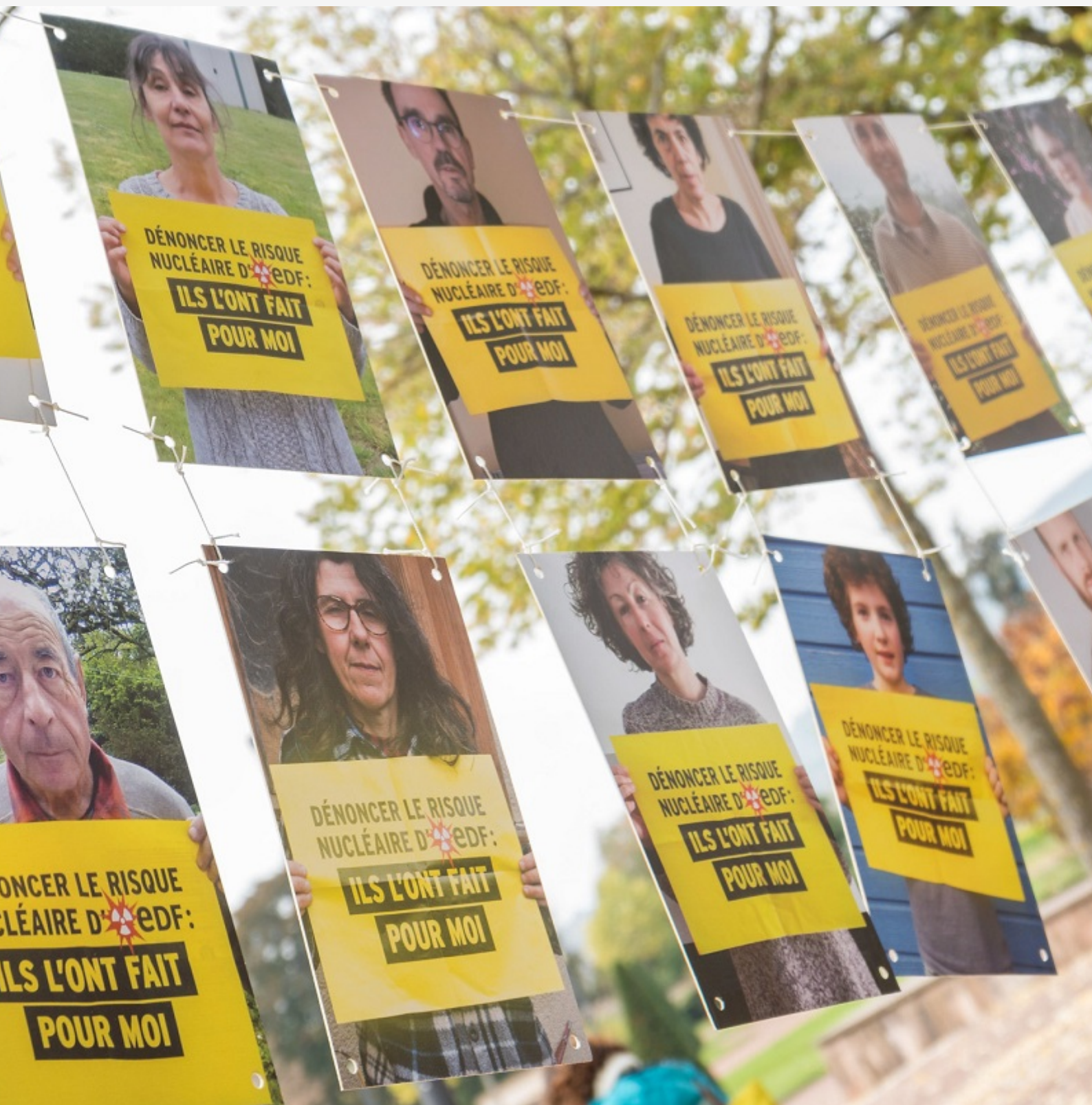
En 2017, des militants de Greenpeace se sont introduits dans la centrale nucléaire de Cattenom. En première instance, deux militants avaient été condamnés à de la prison ferme.

Comment encourager la citoyenneté collective dans un contexte qui n'a de cesse de la décourager ? Comment mettre fin à ces pratiques abusives ? Les membres de l'observatoire ont